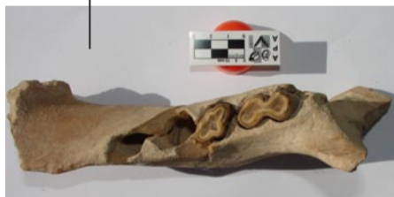
Restos fósiles hallados por investigadores de la UNLPam.

Esa denuncia se realiza en aquellas instituciones de la provincia de La Pampa relacionadas con la problemática paleontológica, tales como la Subsecretaría de Cultura, el Museo de Ciencias Naturales y el Archivo Histórico Provincial.