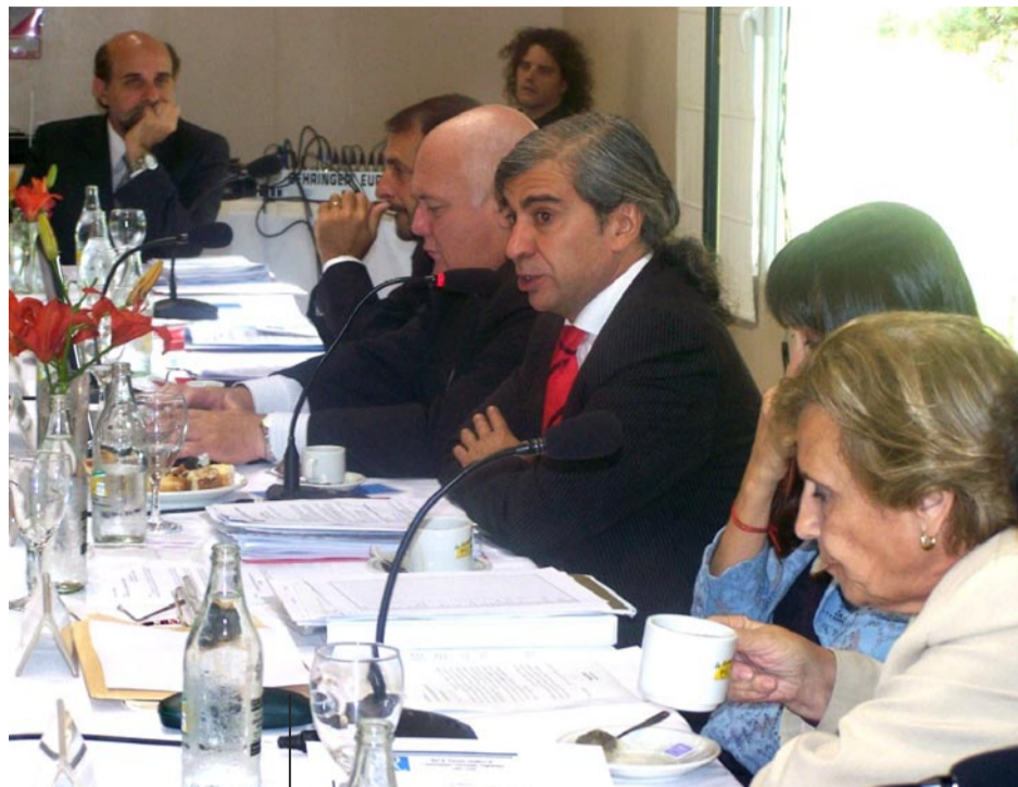
Los recorres del CIN, durante una de las reuniones en La Campiña.

Durante tres días la provincia de La Pampa fue el centro de la escena nacional universitaria, como consecuencia de las deliberaciones que llevaron a cabo los Rectores de las Universidades e Institutos Nacionales que integran el sistema, enmarcados en el encuentro del Consejo Interuniversitario Nacional (CIN), que se caracterizó por un clima de convivencia y respeto.